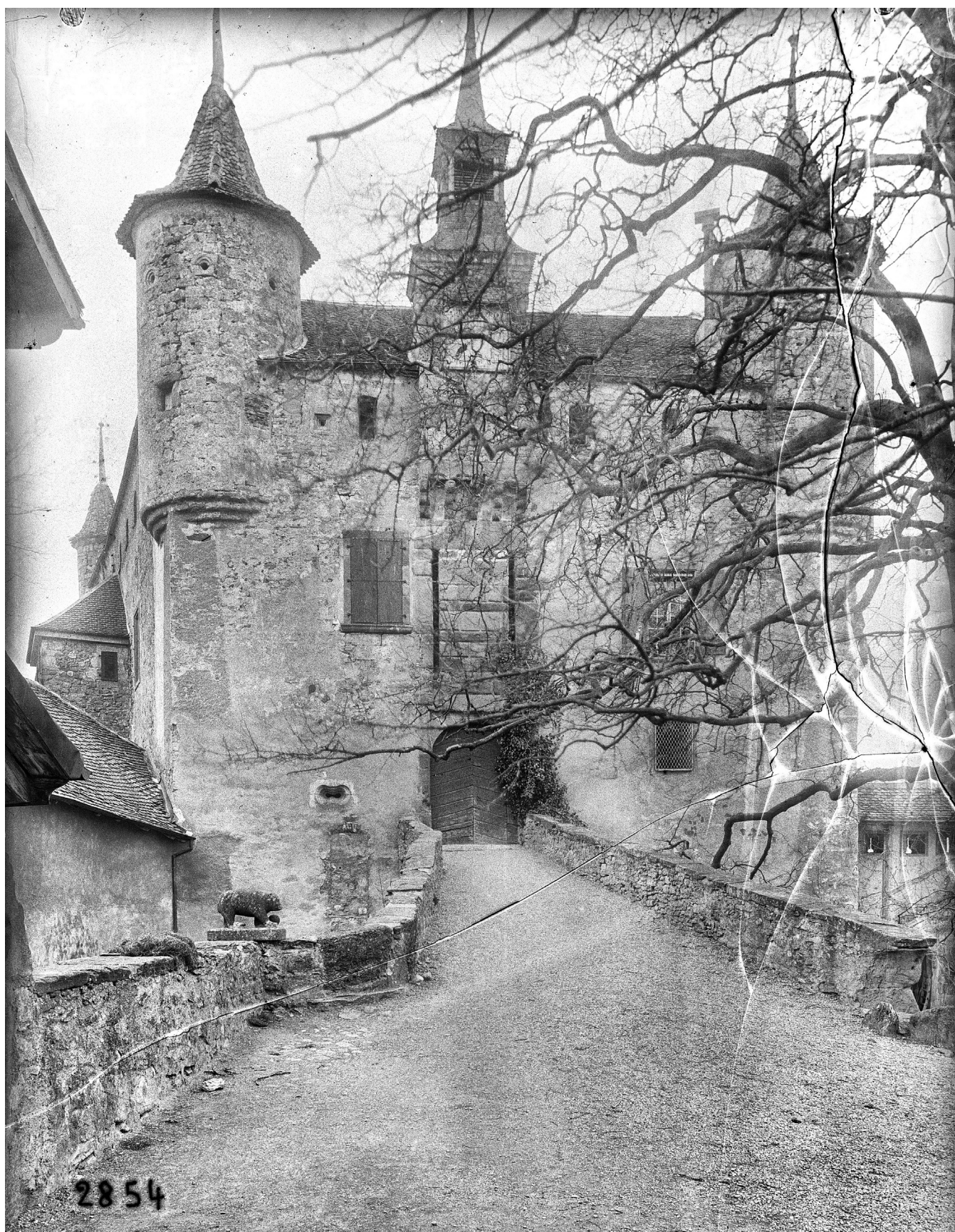
En 1899