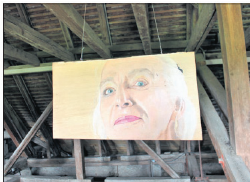
Un des portraits de «God save the Queer»

Ouverte les samedis de 14h à 17h et les dimanches de 14h à 18h ou sur rendez-vous. En présence de l'artiste les 14 mai, 10 juin, 8 juillet, 27 août, 24 septembre et sur rendez-vous.