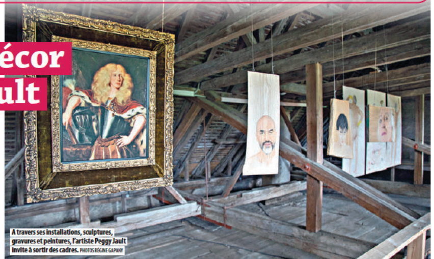
A travers ses installations, sculptures, gravures et peintures, l'artiste Peggy Jault invite à sortir des cadres. PHOTOS RÉGINE GAPANY

Ainsi en est-il de la première pièce du château-recto/verso : Le nid . Il s'agit d'un lit joliment dressé surmonté d'une structure en fer forgé qui l'enferme. Loin de la vision idéalisée du lit à baldaquin des princesses, la sculpture évoque les contraintes d'enfermement du mariage et les violences dont il peut être le terrain. «J'avais envie de parler des viols conjugaux, de l'inceste, mais aussi de ces femmes qui ont peut-être choisi leur mari, mais pas leur vie.»